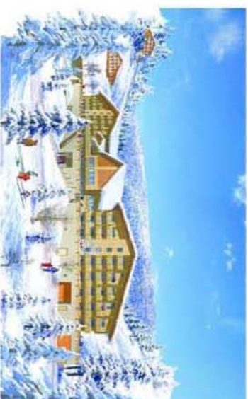
SUITE N° 105 (Duplex) - T3- niveau 1